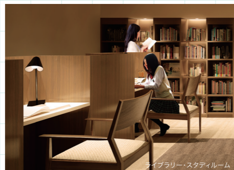
ライブラリー・スタディールーム

勉強や読書など、集中したい時に嬉しいライブラリー・スタディールーム。静かな空間なら、お子様も自然と、勉強に身が入るのではないのでしょうか。