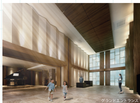
グランドエントランス

2層吹き抜けの「グランドエントランス」は、敷地の広さを贅沢に活かした開放的な空間。あなたのお気に入りのひとつになれば、幸いです。