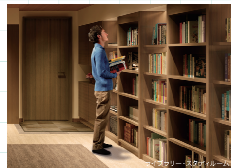
ライブラリー・スタディールーム

蔵書約2,000冊のライブラリー・スタディールームでは、雑誌もさまざまに取り揃えています。買わずにここで読めば、古雑誌を片付ける手間も省けますよね。